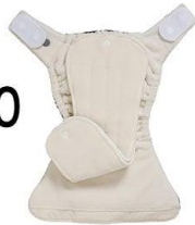
KINDS OF CLOTH DIAPERS